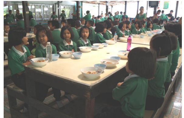
นักเรียนนั่งเป็นระเบียบเรียบร้อย รอพี่ยกป้ายแสดงสัญลักษณ์เพื่อให้คะแนนในขณะรับประทานอาหาร